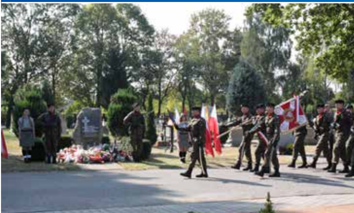
Na Cmentarzu Komunalnym w Krośnie Odrzańskim odbyły się uroczystości patriotyczne związane z 77. rocznicą agresji ZSRR na Polskę