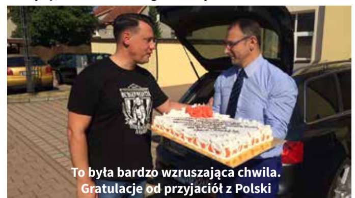
To była bardzo wzruszająca chwila. Gratulacje od przyjaciół z Polski