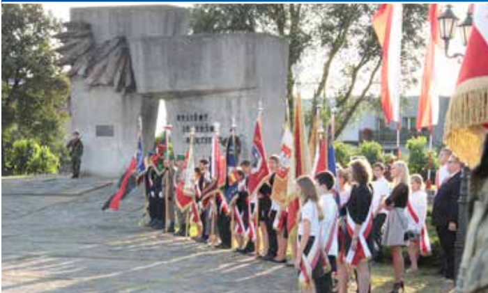
1 września. Ten dzień na zawsze pozostanie na kartach historii. W Krośnie Odrzańskim obchody patriotyczne tradycyjnie odbyły się na placu św. Jadwigi Śląskiej