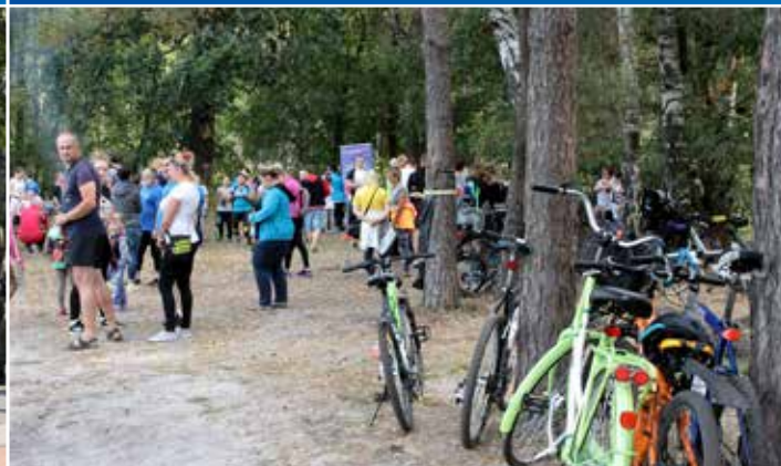
V Rowerowy Raj Rodzinny ponownie cieszył się ogromnym zainteresowaniem. Atmosfera była wspaniała. Łącznie w wydarzeniu wzięło udział aż 150 osób!