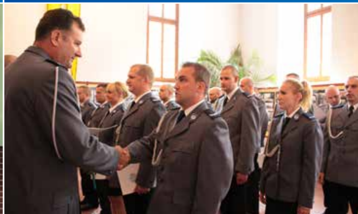
Święto Policji to przede wszystkim okazja do podziękowania funkcjonariuszom za odpowiedzialną służbę. To ich praca przyczynia się do poprawy bezpieczeństwa mieszkańców