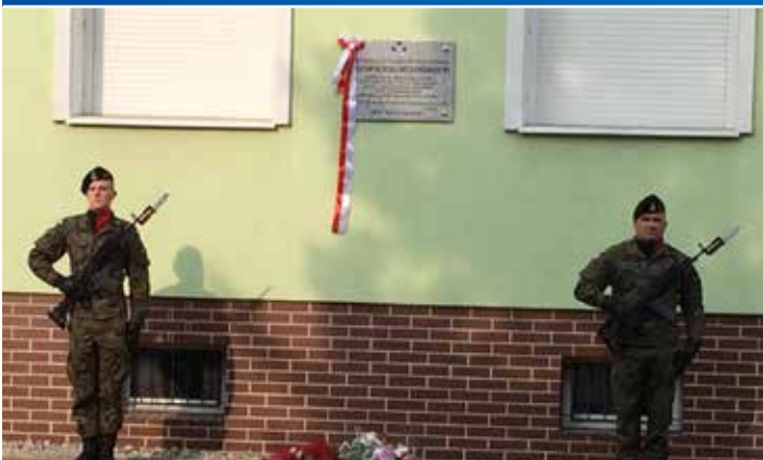
W sobotę 17 września na placu 11. Pułku odbyło się uroczyste odsłonięcie tablicy pamiątkowej 11. Złotowskiego Pułku Zmechanizowanego. Stacjonował on w Krośnie Odrzańskim w latach 1952-1989