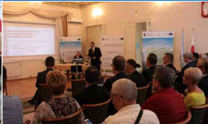
16 września odbyła się I Konferencja Przedsiębiorstw Wodociągowych. Była to doskonała okazja, aby podsumować dotychczasowe działania KPWK oraz Gminy. A te są na miarę XXI wieku