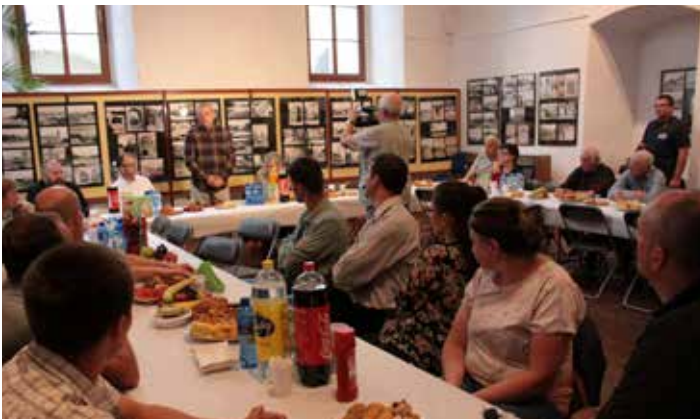
8 sierpnia przypada Dzień Pszczół. Z tej okazji w Zamku Piastowskim odbyła się konferencja Lubuskiego Związku Pszczelarzy