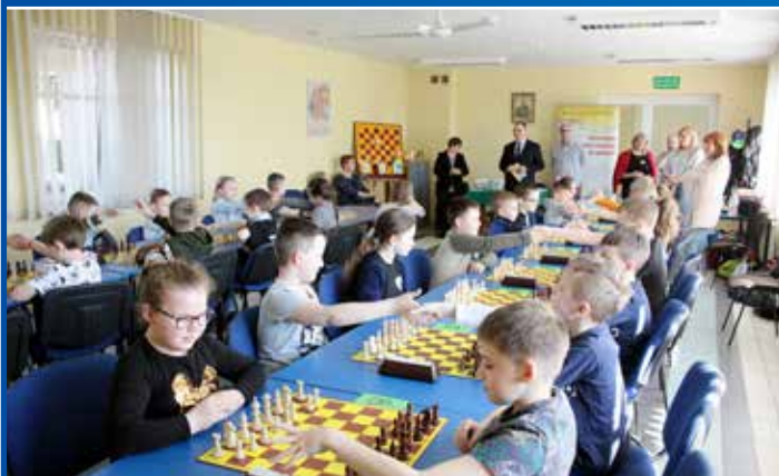
Szachy rozwijają. W Krośnie Odrzańskim to bardzo popularna dyscyplina sportu. Na zdjęciu finał rozgrywek turniejowych.