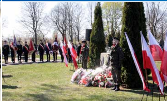
Krośnienie uczli pamięć 14,5 tys. jeńców wojennych, oficerów i policjantów z obozów w Kozielsku, Starobielsku i Ostaszku zamordowanych przez NKWD.