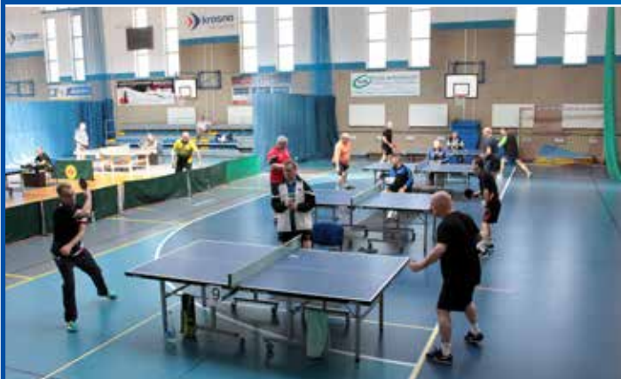
Może przy którymś ze stołów grał następca Lucjana Błaszczyka? XXVIII Otwarte Mistrzostwa Krosna Odrzańskiego w tenisie stołowym.