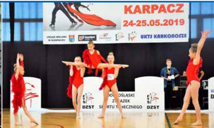
Podopieczne Studia Tańca Calipso zajęły 1 miejsce na Otwartym Pucharze Polski w nowoczesnych formach tańca, który odbył się w Karpaczu. Gratulujemy.