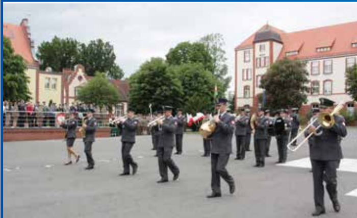
Nadodrzański Oddział Straży Granicznej obchodził 10-lecie istnienia.