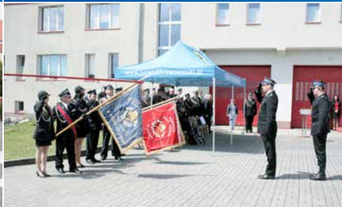
Tradycyjnie w maju uroczystość obchodzą święto Straży Pożarnej.