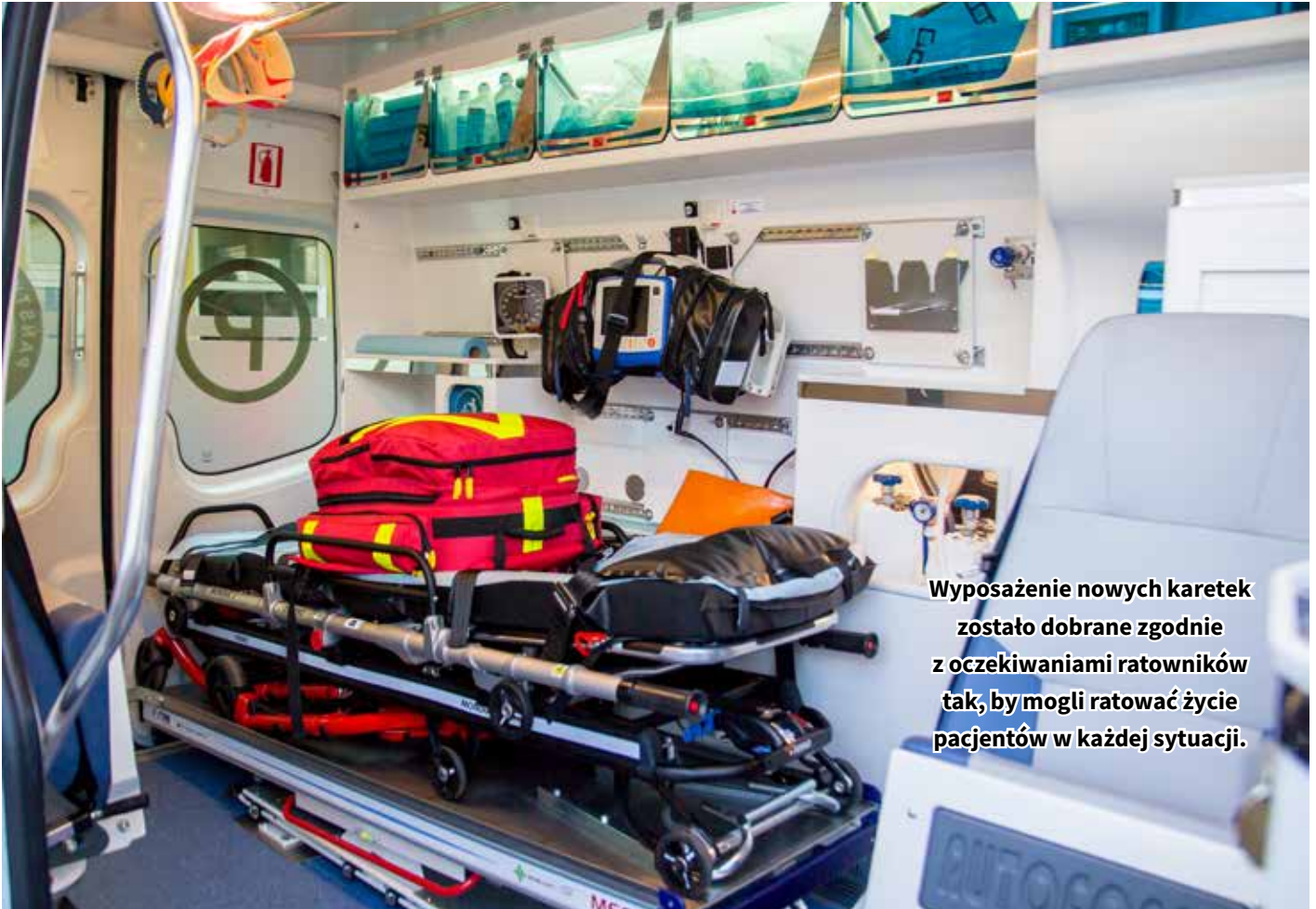
Wyposażenie nowych karetek zostało dobrane zgodnie z oczekiwaniami ratowników tak, by mogli ratować życie pacjentów w każdej sytuacji.