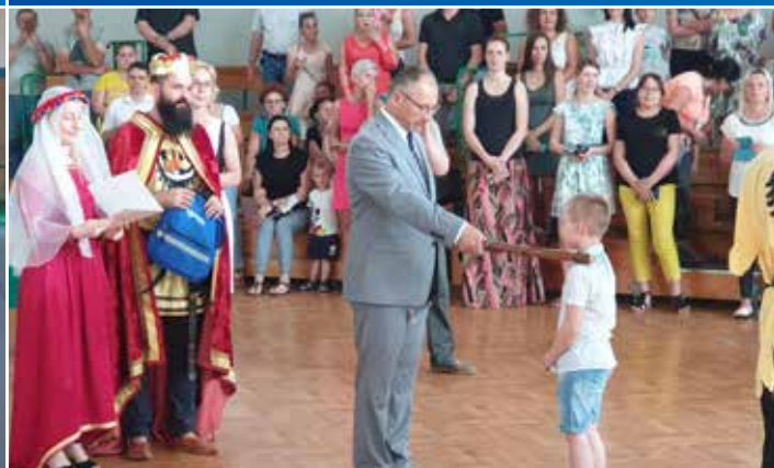
Ponad 160 absolwentów przedszkoli zostało symbolicznie pasowanych na Małych Obywateli Gminy Krosno Odrzańskie. We wrześniu rozpoczyna naukę w szkołach podstawowych.