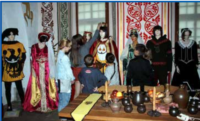
Noc Muzeów w Krośnie Odrzańskim. Duchy i zamknięte komnaty na Zamku Piastowskim.