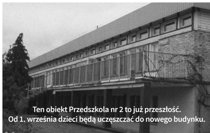
Ten obiekt Przedszkola nr 2 to już przeszłość. Od 1. września dzieci będą uczęszczać do nowego budynku.

Wielkie emocje, rewelacyjne zadania, 7 drużyn, 21 zawodników, kilkadziesiąt pytań i maksymalnie 45 punktów do zdobycia. Tak właśnie można opisać trzecią już grę miejską. Do tegorocznej edycji zostali zaproszeni uczniowie szkół podsta-