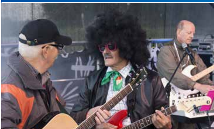
Krośnieńskie Dinozaury po latach przerwy znów na scenie. Porwali publiczność największymi polskimi szlagierami.