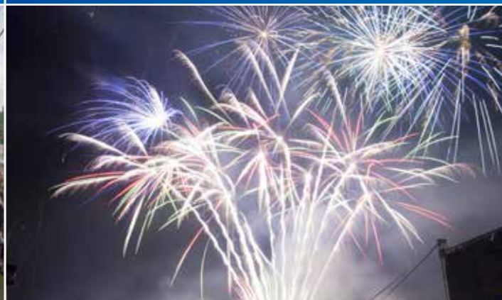
Pierwszy dzień święta zakończył efektowny pokaz ogni sztucznych. Krośnieńskie niebo rozświetliło się tysiącem fajerwerków.