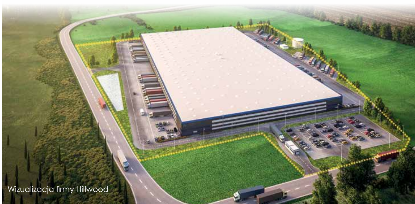
Wizualizacja firmy Hillwood

Przypomnijmy, nabywcą działek jest świebodzińska firma Next Step Investments S.A. Kwota, jaką udało się uzyskać w drodze przetargu, to blisko milion złotych.