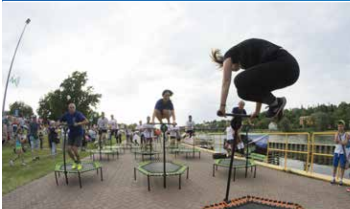
Rybobranie na sportowo. Turniej Krośnian był wielką atrakcją nie tylko dla zawodników, ale i widzów, którzy przyglądali się zmaganiom.