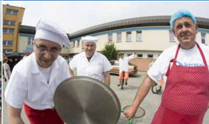
Komu zupę rybną, komu? Krośnieńscy radni tym razem w roli kucharzy.