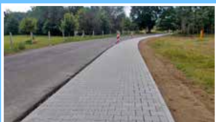
Chodnik w Retnie