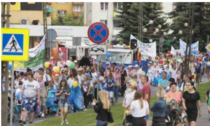
Parada rybobraniowa. Widowiskowa, z roku na rok coraz bardziej okazała. Tym razem było ponad 500 uczestników.