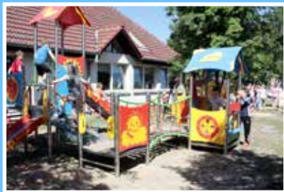
Plac zabaw w Węzyskach - otwarty 1 czerwca br.