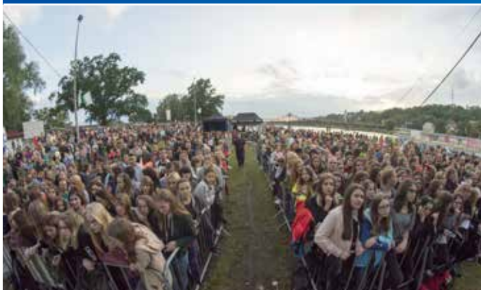
Gwiazdy Rybobrania 2017 przyciągają do Krosna Odrzańskiego tłumy z całego województwa.