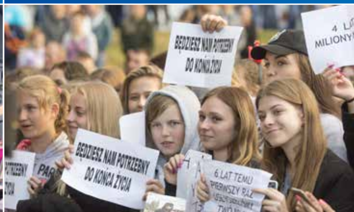
Czekały na ten występ wiele godzin, przejechały sporo kilometrów. Wszystko po to by wyznaczyć swoje uwielbienie Dawidowi Kwiatkowskiemu.