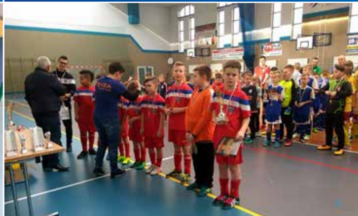
24 lutego odbył się Turniej Orlika o Puchar Burmistrza Krosna Odrzańskiego. Wzięło w nim udział 8 zespołów, w tym aż trzy reprezentujące barwy Tęczy Homanit. Najlepsi z krośnian zajęli II miejsce.