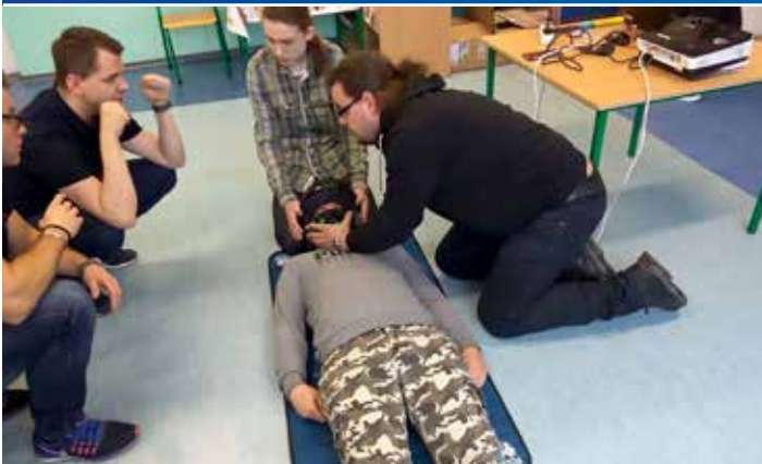
Członkowie Moto Forum Krosno Odrzańskie po raz kolejny wygrali głosowanie i w ramach akcji MotoPomocni szkolili się z zakresu udzielania pierwszej pomocy.