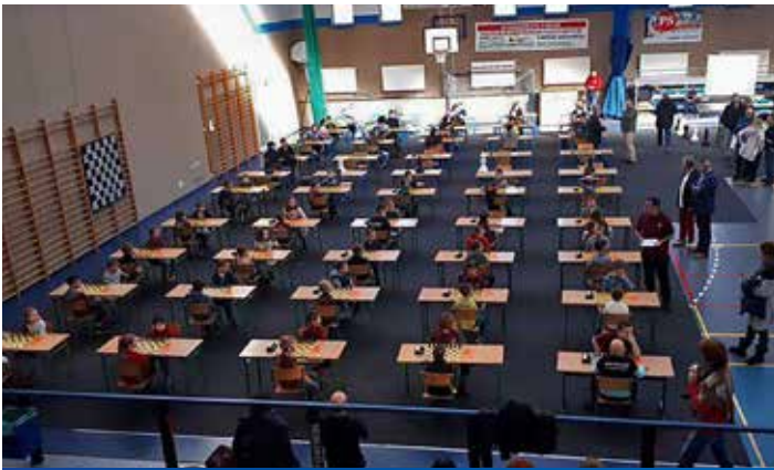
Festiwal Szachowy i Turniej Brydża jak zawsze cieszy się sporym zainteresowaniem miłośników gier umysłowych.