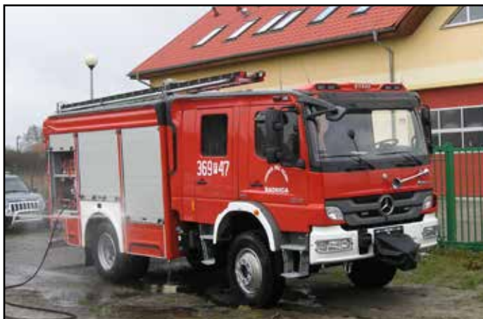
Nowoczesny wóz strażacki zakupiony ze środków zewnętrznych jest już na wyposażeniu OSP z Radnicy

Samochód będzie mieć moc minimum 280KM, zbiornik wody o pojemności nie mniejszej niż 3000 litrów oraz agregat prądotwórczy. Oprócz udziału pojazdu w akcjach ratowniczo – gaśniczych, zakupiony samochód będzie służył do przewożenia sprzętu niezbędnego do zabezpieczenia ratowników podczas działań ratowniczych podczas powodzi, a także w czasie odgraniczania i zwalczania zagrożeń chemiczno – ekologicznych, co wpisuje się w gminny plan zarządzania kryzysowego. Pieniądze zostały przyznane, teraz trzeba przygotować przetarg i dokonać wyboru dostawcy, który zbuduje auto według specyfikacji. Strażacy z Wężysk wsiądą do nowego wozu w drugiej połowie roku.