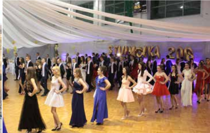
Krośnieńscy maturzyści mają za sobą Bal Studniówkowy. Teraz, już tylko wielkie odliczanie do matury...