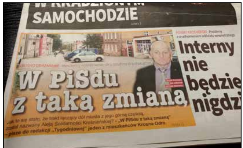
Lokalny tygodnik w ostrych słowach krytykuje nadanie nazwy „Aleja Solidarności Krośnieńskiej”. Temat bulwersuje krośnian.