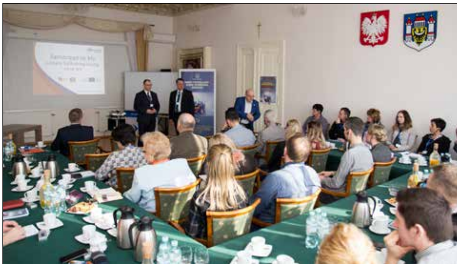
Siedemnaście lat współpracy Krosna Odrzańskiego i Schwarzhilde. Tym razem doświadczenia wymieniali samorządowcy.

Projekt realizowany był z Funduszu Małych Projektów w Euroregionie „Sprewa-Nysa-Bóbr”, w ramach Europejskiej Współpracy Terytorialnej.