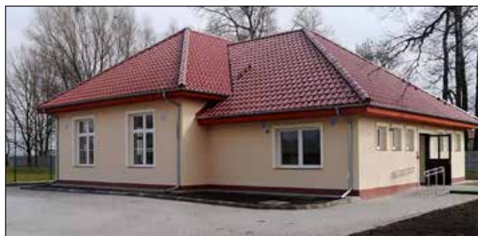
Jeszcze w tym roku świetlica tego typu ma powstać w Starym Raduszczyku

Budynek został zaprojektowany jako obiekt wolnostojący przeznaczony do organizacji imprez takich jak zabawy wiejskie, wesela, zebrania itp. Obiekt wyposażony będzie w zaplecze kuchenne i zmywalnię wraz z wyposażeniem. Zaprojektowano budynek murowany, parterowy, bez podpiwniczenia, z poddaszem nieużytkowym. Zaplanowano praktycznie bezobsługowe ogrzewanie budynku energią elektryczną, za pomocą pieców akumulacyjnych pobierających energię elektryczną w taryfie weekendowej, gdzie energia elektryczna jest najtańsza. Na ekonomikę użytkowania mają pozytywnie wpływać solidnie docieplone ściany i poddasze budynku. Na jakim etapie jest inwestycja? Uzyskano decyzję o pozwoleniu na budowę i decyzję konserwatora zabytków na lokalizację