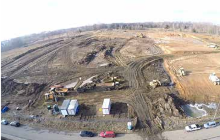
Prace na strefie przemysłowej trwały mimo siarczystych mrozów. Wkrótce rozpocznie się montaż elementów konstrukcyjnych hali.