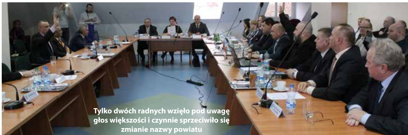
Tylko dwóch radnych wzięło pod uwagę głos większości i czynnie sprzeciwiło się zmianie nazwy powiatu